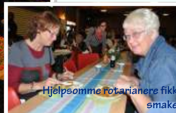
Hjelpsomme rotarianere fikk smake