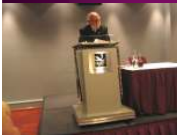
Vellykket Citymøte i Bergen