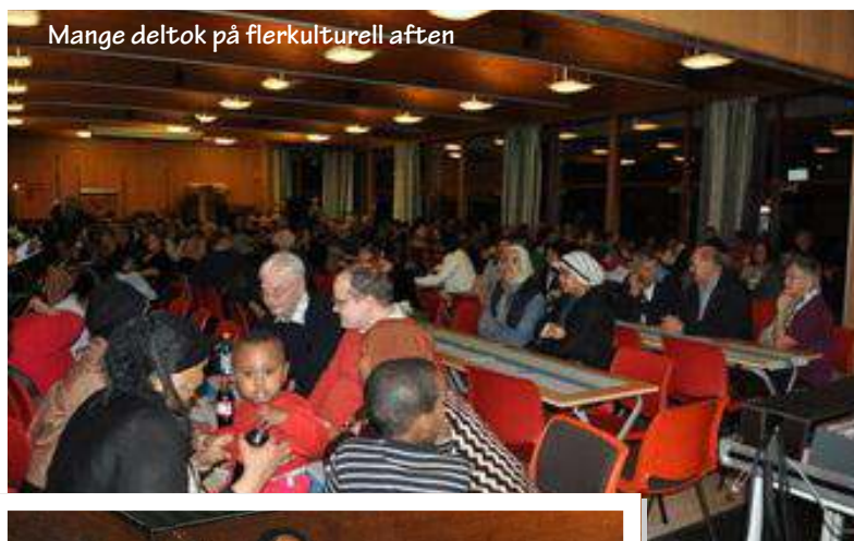
Mange deltok på flerkulturell aften

Askøy Rotary Klubb har også i år vært deltakende arrangør av Flerkulturell aften. Sammen med Askøy Røde Kors og kulturavdelingen i Askøy Kommune, har vi maktet å få til et arrangement som nå har blitt en tradisjon i oktober måned.