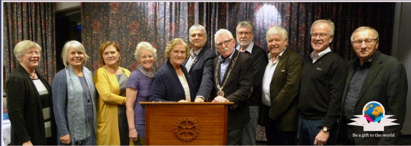
Voss Rotaryklubb, Distr. 2250 - 13. januar 2016 - opptak av 5 nye medlemmer.

«Før ferien i fjor sommar ba eg alle medlemmene møta i august med eit eller fleire forslag til nytt medlem. Det kom inn heile 50 forslag og alle desse fekk så eit brev frå klubben. Etter litt tid vart alle ringde opp frå sine forslagsstillarar og spurde om dei ville ha meir info. Då fekk me 21 interessentar og alle dei fekk den nye brosjyren og vart inviterte til eit møte. I løpet av hausten har me hatt innom 14 personar og det ser no ut til at 9 av desse vert medlemmer i løpet av mars.»