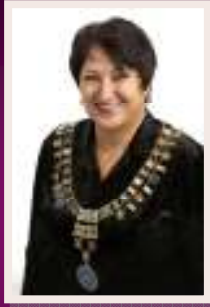
DG Ingunn Mossefin