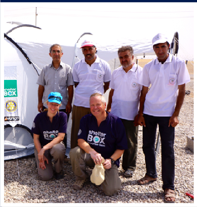
ShelterBox Response Team Iraq sammen med lokale hjelpere

Fremme i området startet jobben vår umiddelbart. Vi fikk raskt kontakt med lokale myndigheter og organisasjoner vi hadde jobbet med forrige gang vi var her, ett år tidligere. Igjen ser vi betydningen av Rotary: Uten hjelp fra lokale rotarianere hadde vårt arbeid i både Irak, Jordan, Libanon, Tyrkia og Syria vært betydelig vanskeligere. Nå ble forholdene lagt vel til rette for vår felles innsats. Fortolling, transport, tolker og innkvartering er bare litt av bistanden som ble gitt oss. Det var ikke vanskelig å bli imponert over den lokale innsatsen for å hjelpe flyktningene. I påvente av bla. telt, var flyktningene midlertidig innkvartert i parker, moskeer, skoler og fabrikkbygninger. Det var åpenbart at behovet for bistand var stort, og i løpet av få dager ble en over 500 ShelterBox telt flydd inn fra et forhåndslager i Dubai. I mellomtiden trente vi opp lokale mannskaper i jobben med å sette opp telt og bruke utstyret på best mulig måte.