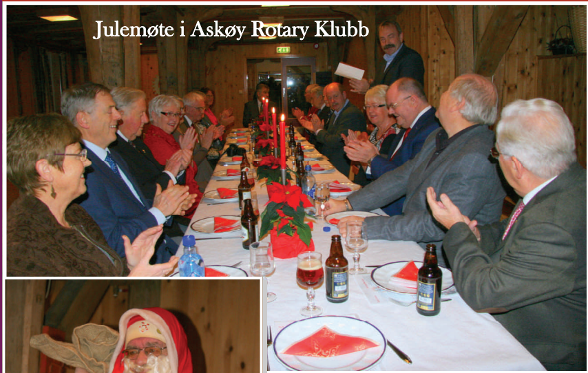
Julemøte i Askøy Rotary Klubb