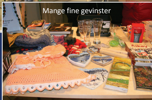
Mange fine gevinster