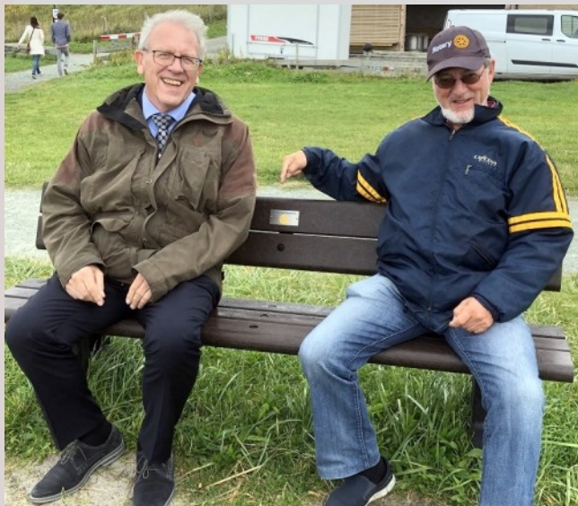
Bilde 4: Guvernøren og AG3

Guvernørens hilsen til klubben under festen ble satt stor pris på. Også hans dikt av Olav H. Hauge og å gjøre hverandre «ei beine»,