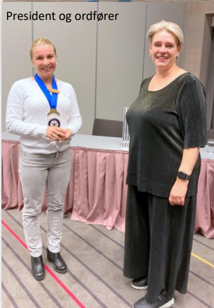
President og ordfører