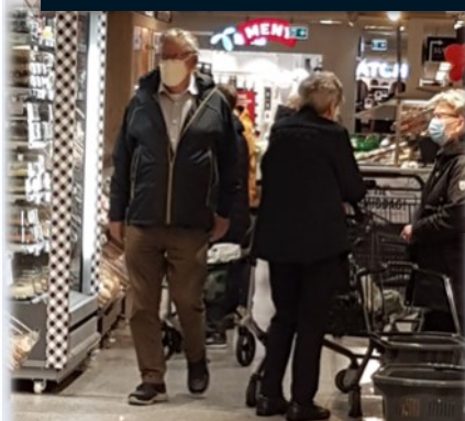
Munnbindene ble brukt av alle