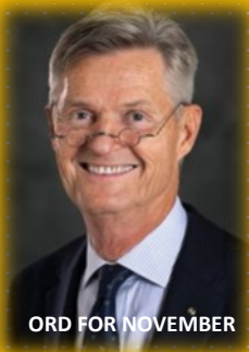
ORD FOR NOVEMBER